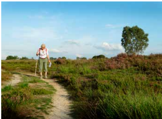
Door de Mechelse Heide.