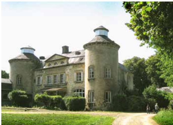
Het kasteel van Leut.