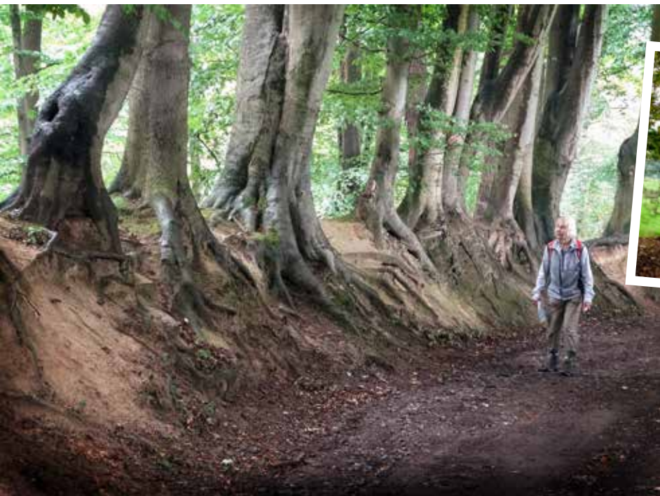
Holle weg langs de Worm.