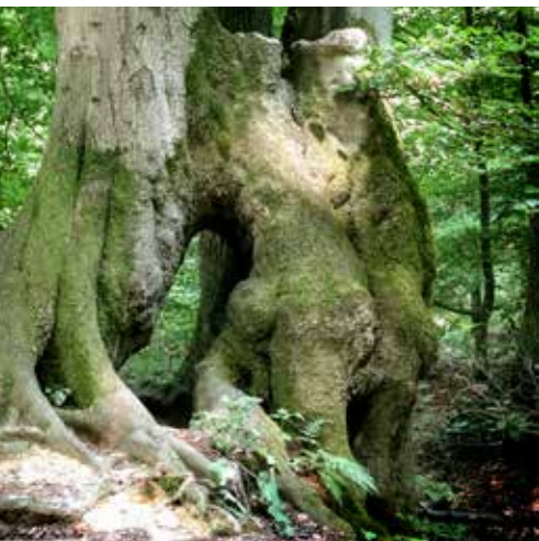
Grensbeuk in het Aachener Wald.

viaduct. We zijn nu vlakbij de Nederlandse grens maar moeten eerst nog op een supersteil paadje naar het plateau klimmen.