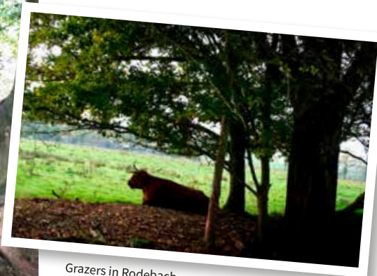
Grazers in Rodebach.

Door het grensoverschrijdende natuurgebied Roode Beek/Rodebach gaan we Duitsland weer in. Er lopen supersmalle paadjes door dit gebied, maar die hebben de grote grazers gemaakt voor eigen gebruik. Ons paadje is wat breder. We blijven meestal in de buurt van de Rodebach. Voorbij Selkant lopen we hoog boven een vijver met geheimzinnig groen